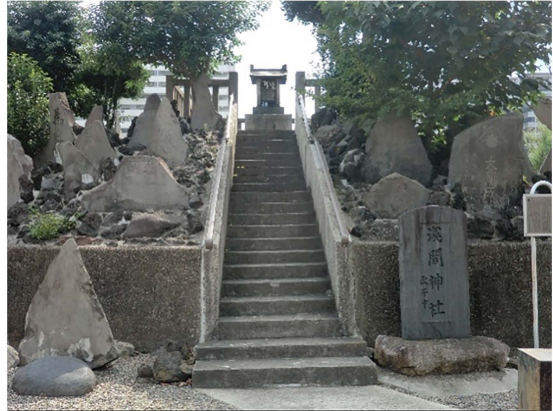
写真11 逆井の富士塚

富士塚の調査は延べ二日間にわたって、香取神社の長島の富士塚、桑川神社の桑川の富士塚、天祖神社の中割の富士塚の調査が行われた。(諏訪神社の平井の富士塚、浅間神社の逆井の富士塚調査は雨天の為順延)にわか雨と蒸し暑さと蚊のなかで行われたが、調査カードの作成や拓本の採取などの富士塚の調査に加われたことは大変有意義な時間を得られたと思います。