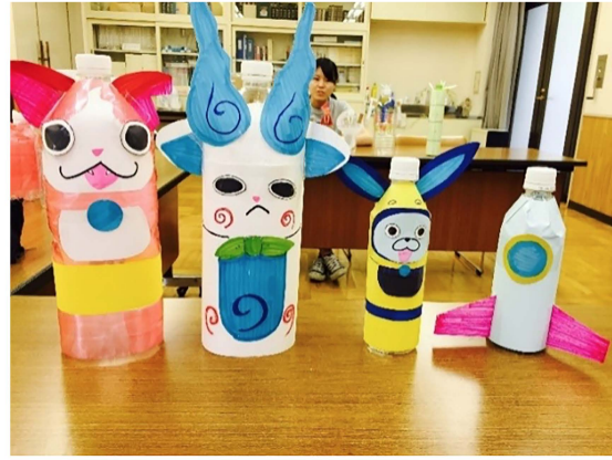
写真9 竹の水鉄砲で遊ぼう！の様子