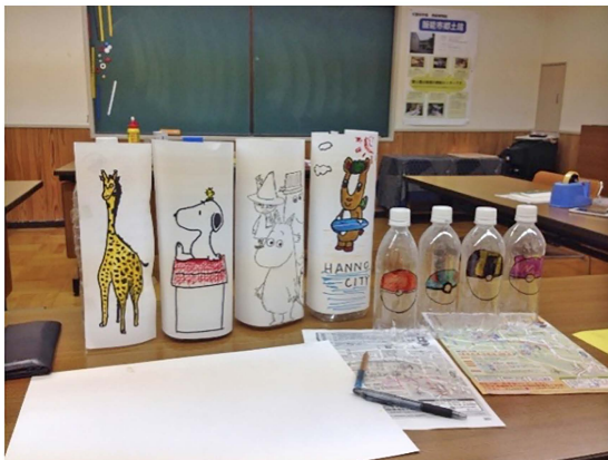
写真6 竹の水鉄砲的作的作りの様子

最後に今回の実習を通して、学芸員の仕事、心構え等について深く学ぶことができた。実習生を受け入れて下さった飯能市郷土館の職員の方々に感謝を申し述べる。