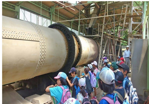
写真7 歴史教室にて武蔵野炭鉞へ訪れた時の様子