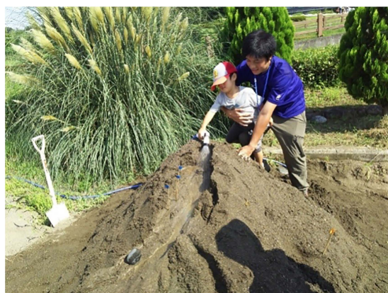
写真3 流水実験の様子