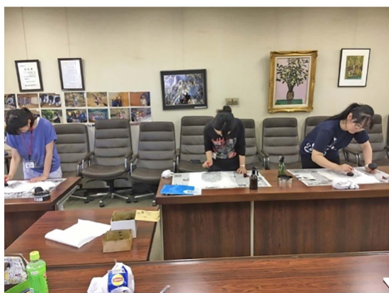
写真4 拓本実習の様子

特別忙しい時期にも関わらず、いつでも丁寧に根気強く指導をしてくださった職員の方々には、心から感謝している。とても充実した12日間だった。