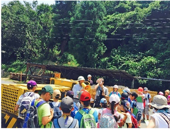
写真8 郷土かるたの旅の様子