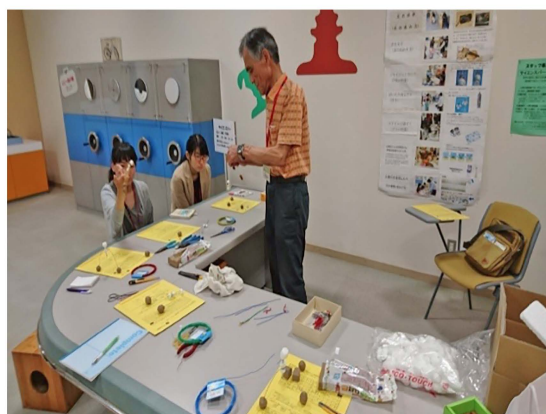
写真5 サイエンスパーでの打ち合わせの様子